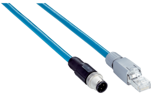
图片可能存在偏差